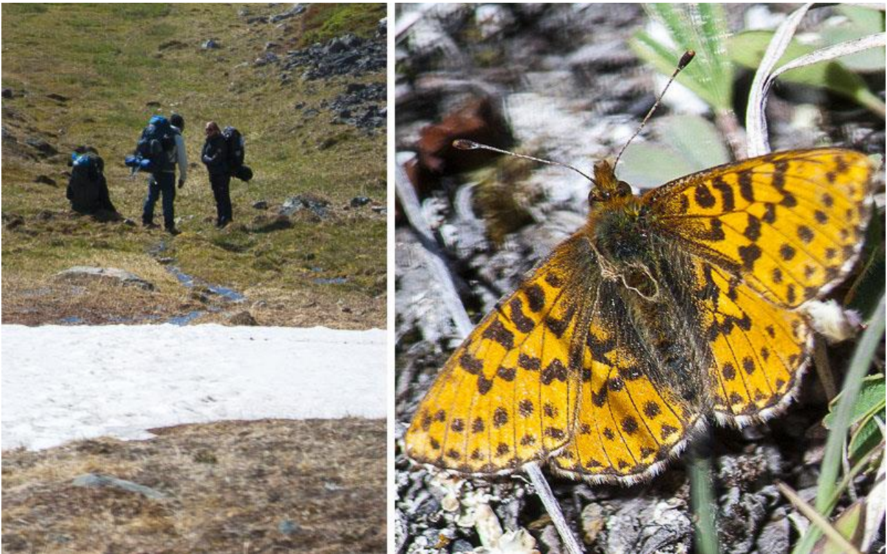
Et sjældent syn - andre mennesker! Og en sommerfugl - arktisk perlemorfugl

Vi møder en del vandrere, der kommer imod os. Ellers har vi kun sjældent mødt mennesker på vores tur. Behagelig vandring fortsætter indtil, vi når Nerumaq-hytten ved 17-tiden. Vi spiser og holder hvil.