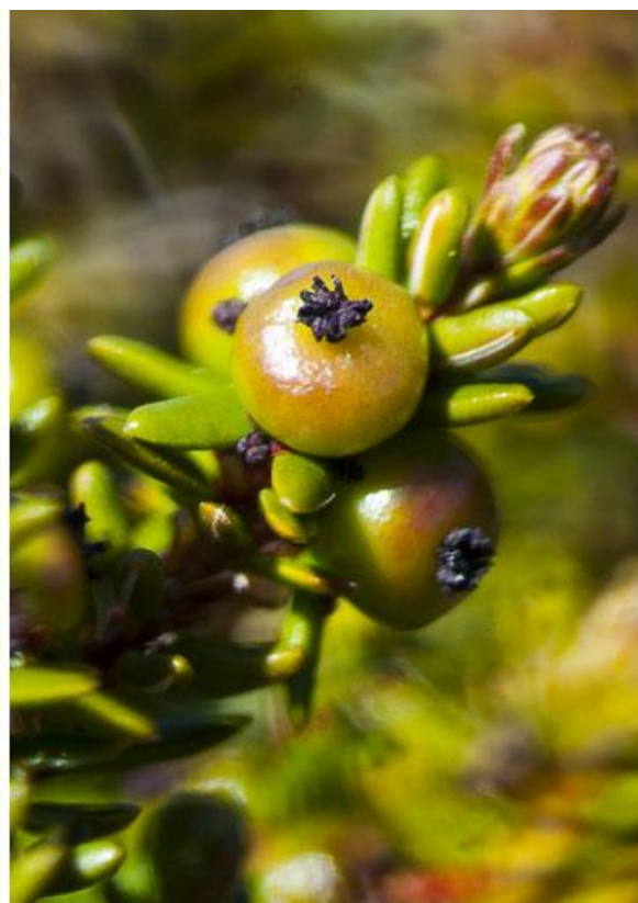
Mosebølle i blomst (tv) og de grønne umodne frugter af sorte bær (th)