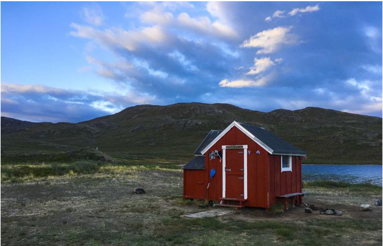
Hytten ved Katiffik