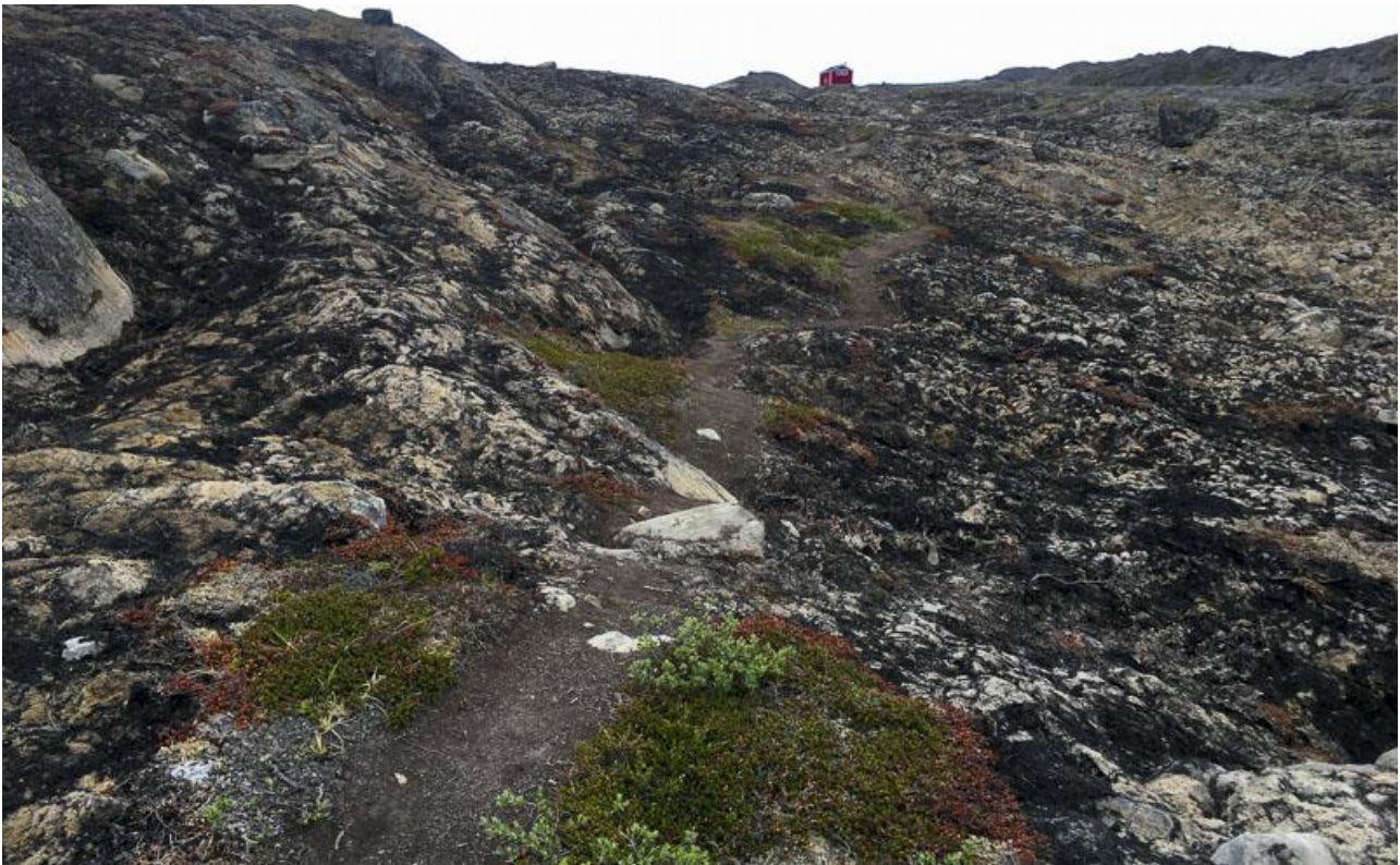
Vegetationen er så småt på vej tilbage efter en omfattende brand i fjeldet året før