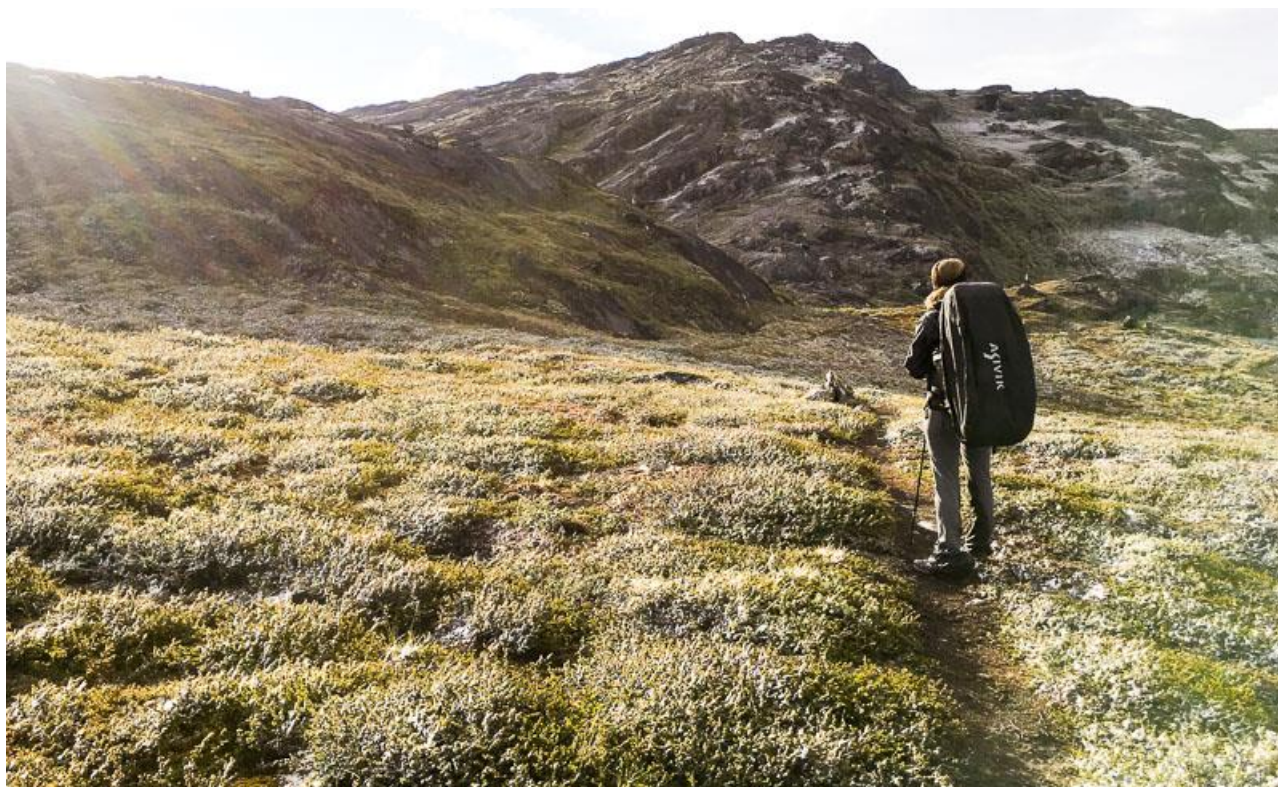
Sneen i vegetationen smelter under midnatssolen.