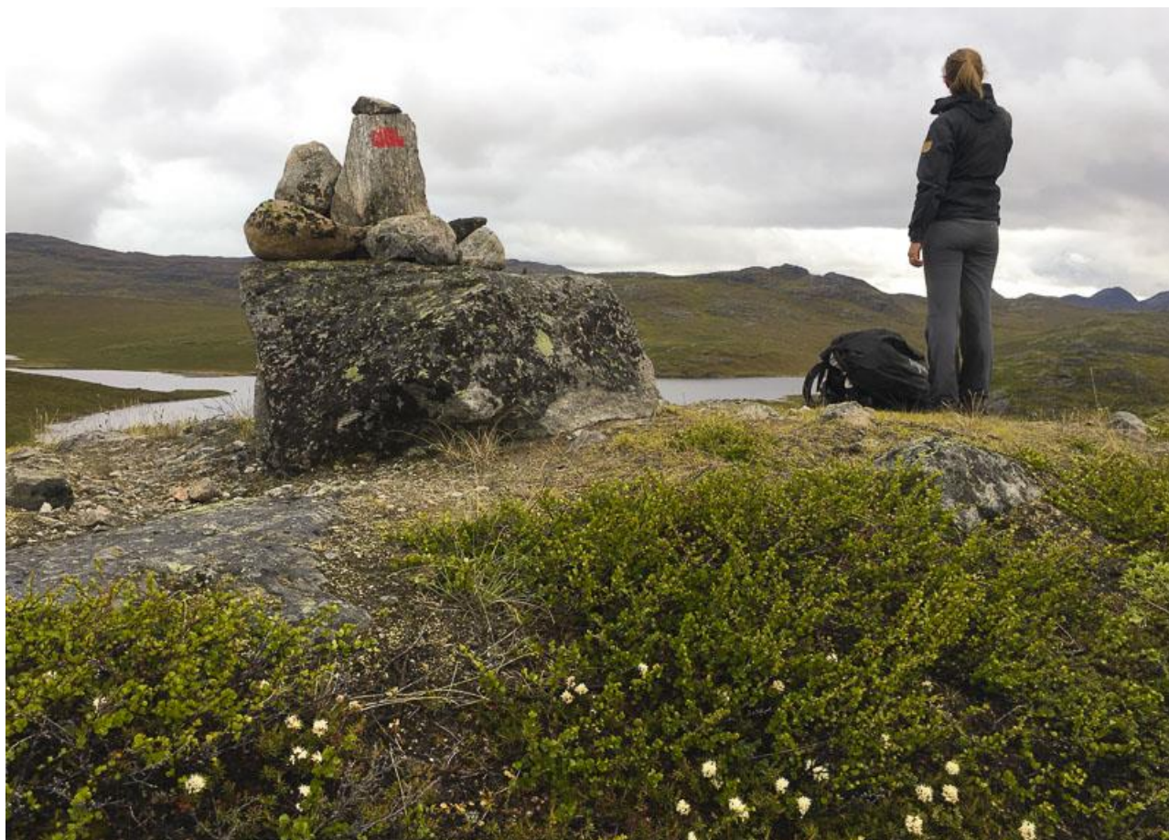
En af ACT-rutens karakteristiske varder med en rød halvcirkel påmalet.

Vandringen giver os en god fornemmelse for terrænet - med smalle nedtrampede stier, der af og til forsvinder - op og ned, for og bagom klipper og skråninger. Vegetationen er meget våd, så trods plastposer i skoene får vi begge ret hurtigt våde sokker. Vi rammes også af stedvis hagl og regn.