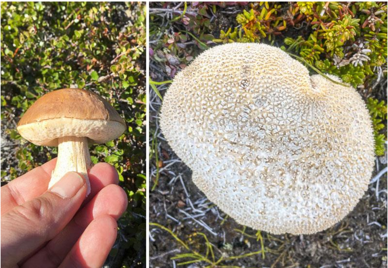
Birke-rørhat (tv) og støvbold (th) er begge velsmagende svampe

I Grønland kendes omkring 700 svampearter. På ACT-ruten ser man ofte birke-rørhat og andre rørhatte, som alle er spiselige og et godt supplement til kosten.