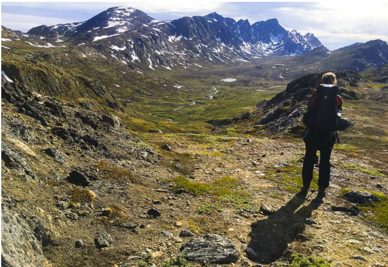
Eventyrland som taget ud af Ringenes Herre