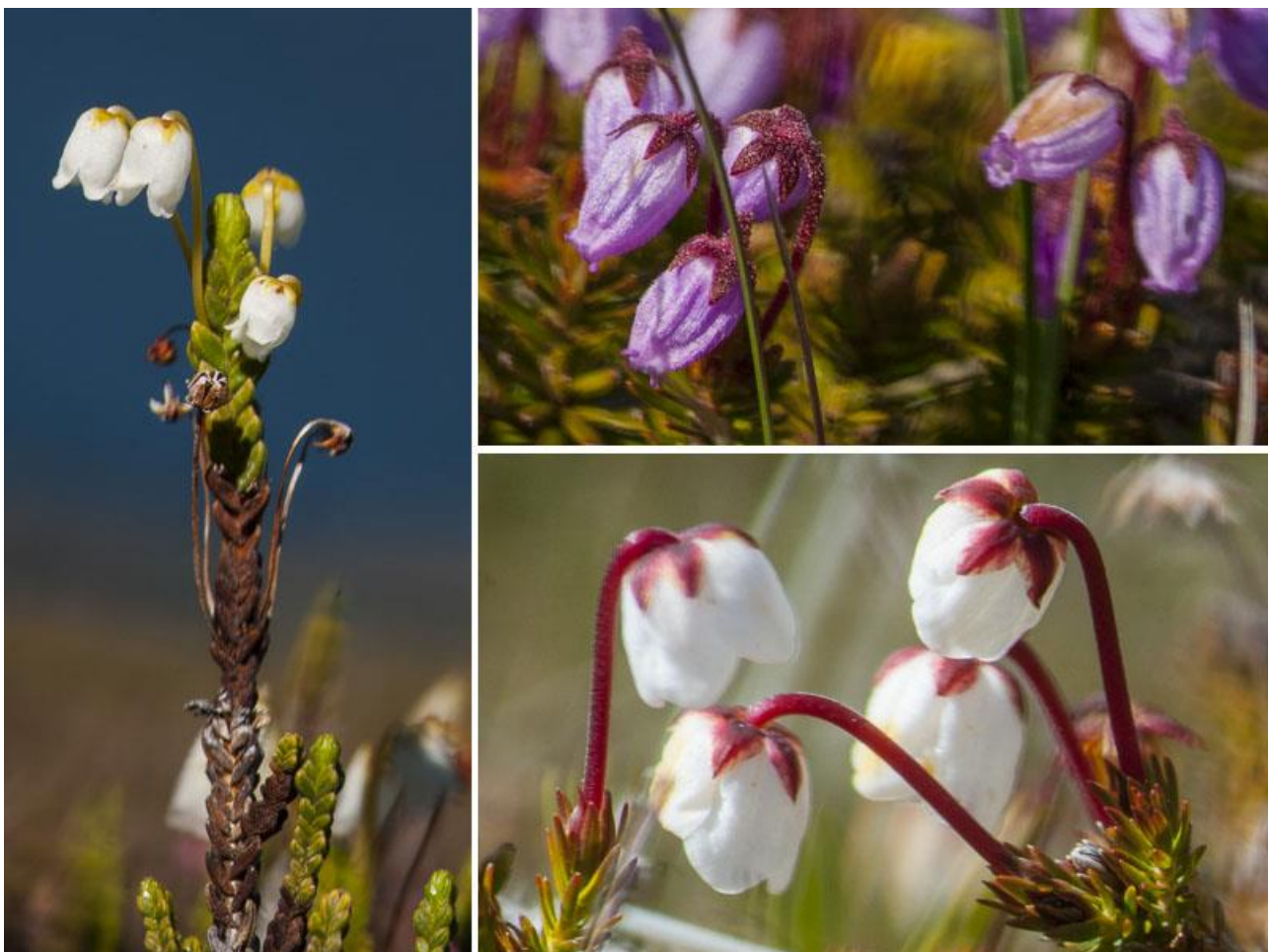
Tre arter af lyng: kantlyng (tv), blålyng (øverst th) og moslyng (nederst th)

Den grønlandske flora omfatter 510 hjemmehørende arter, og mindst en tredjedel af dem findes i området langs ACT. Man kan bl.a. opleve den rødviolette storblomstret gederams, Grønlands nationalblomst, og den stærkt aromatiske hvidblomstrede mosepost.