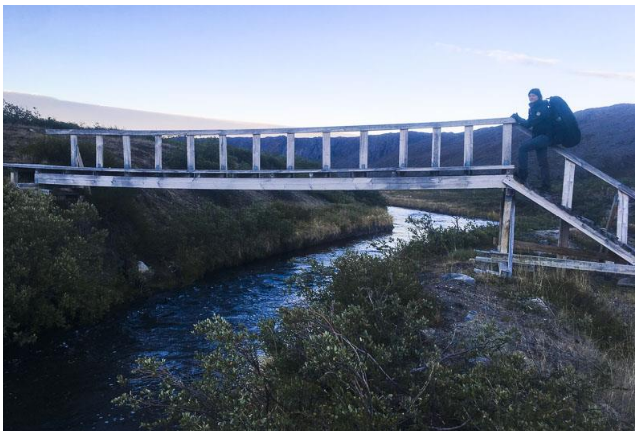
Vi krydser Oles Lakseelv ved midnatstide.