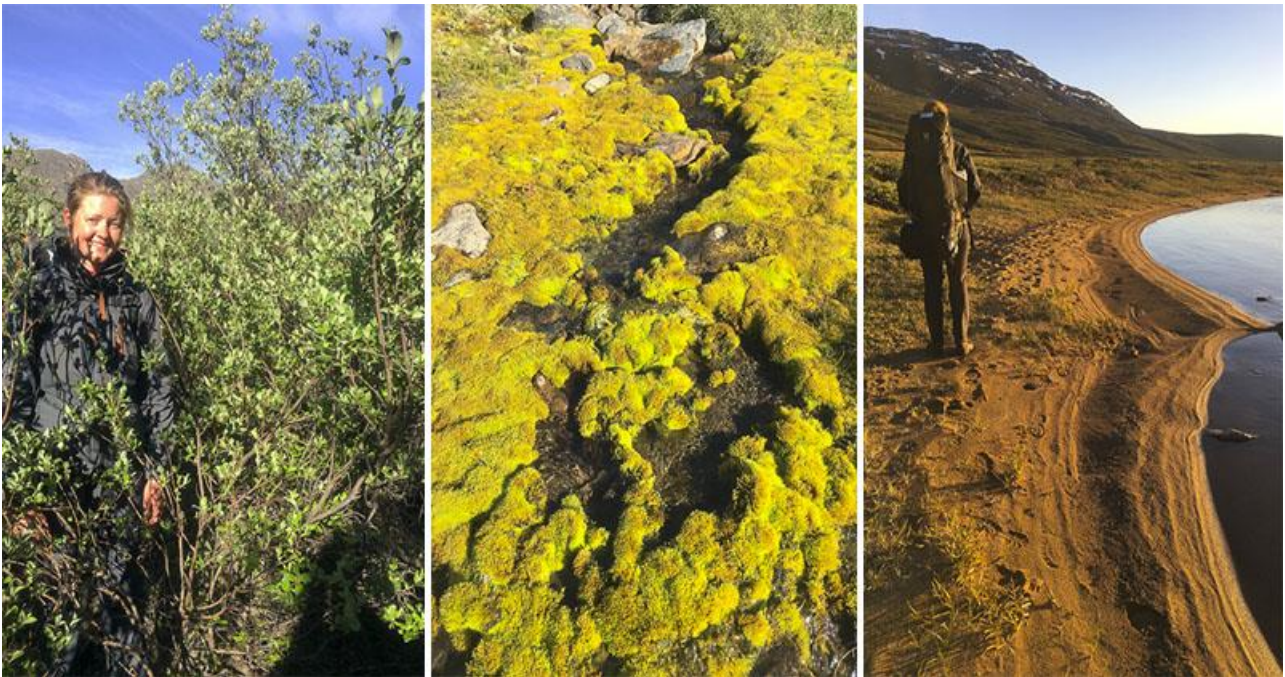
Arktisk pil (tv), vældmos (midt) og sandbred (th)

Mere sumpet og tungt dalterræn følger langs den samme elv, før vi når til en sø. I den lave midnatssol går vi de sidste kilometer skiftevis på sand, sump og krathede. Jeg kan huske, at jeg på et tidspunkt er ved at segne af træthed, mens Kia bare suser afsted. Vi finder endelig den hytte, vi vil overnatte i. Den ligger ud til bunden af den store Kangerluarsuk Tulleq fjord. Desværre kommer vi til at vække to personer i hytten, som viser sig at være en far og søn, der arbejder for kommunen med at vedligeholde ruten og hytterne.