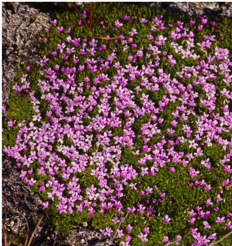
Grønlandsk blåklokke (tv) og tue-limurt (th)