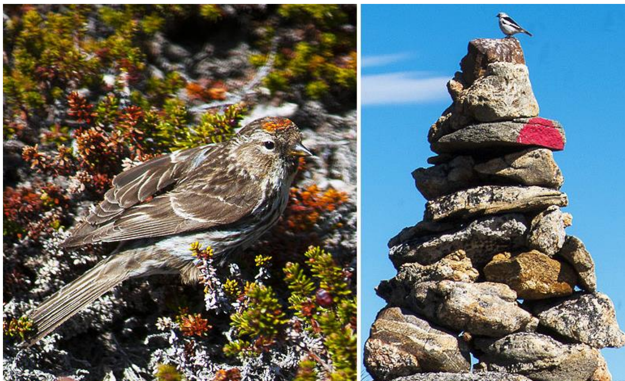
Gråsisken (tv) og snespurv (th)

Med fluer og myg som iøjnefaldende undtagelser er insektlivet generelt artsfattigt. Af dagsommerfugle findes der kun to arter: Arktisk perlemorfugl med brunorange vinger og et karakteristisk mønster af sorte pletter og høsommerfugl med smukke orangegule vinger. De har begge flyvetid i juni-august og lever i tørre blomsterrige områder. I alt er der op mod 100 insektarter i området, herunder natsværmere, biller og edderkopper.