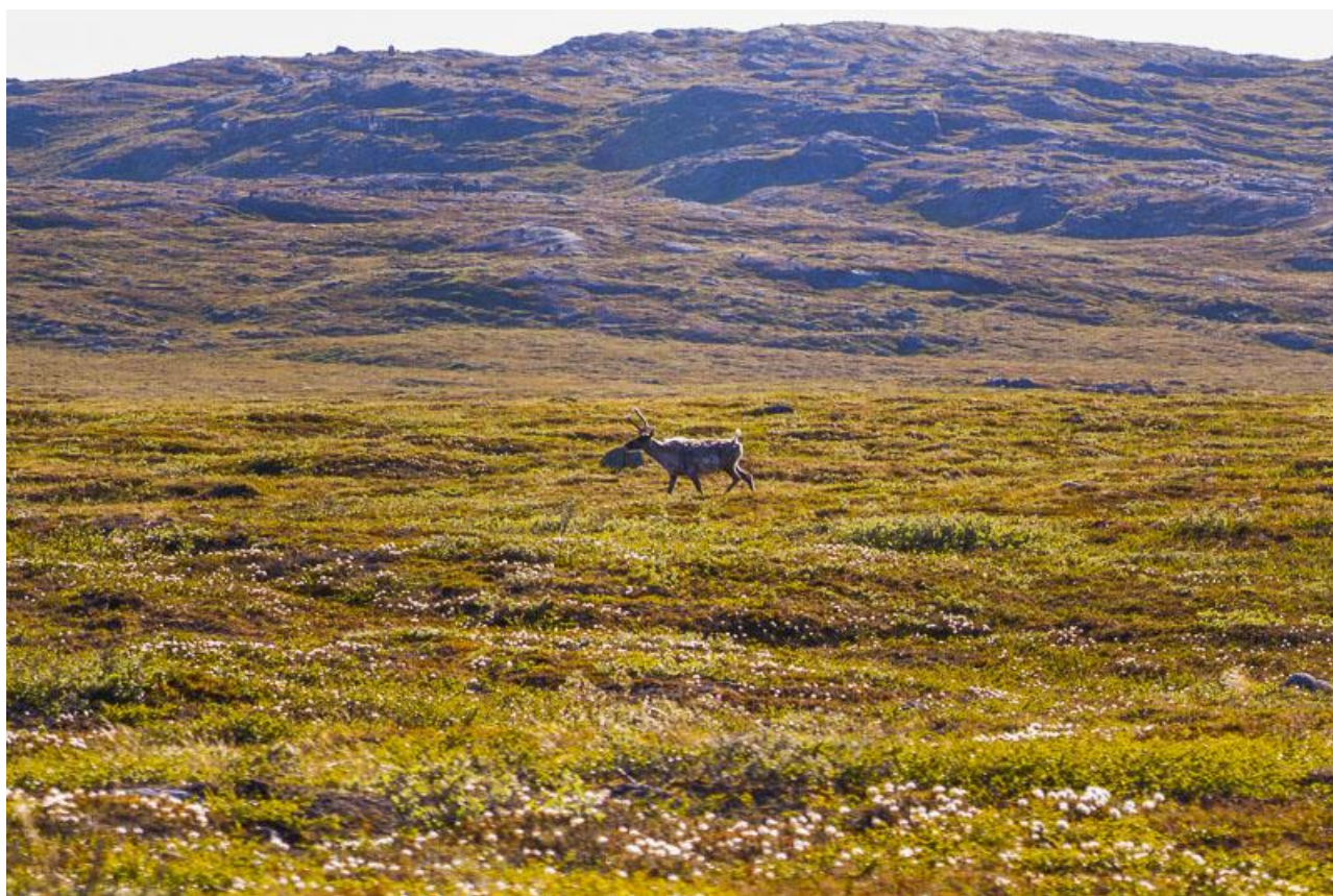
Enligt rensdyr i fjeldlandskabet