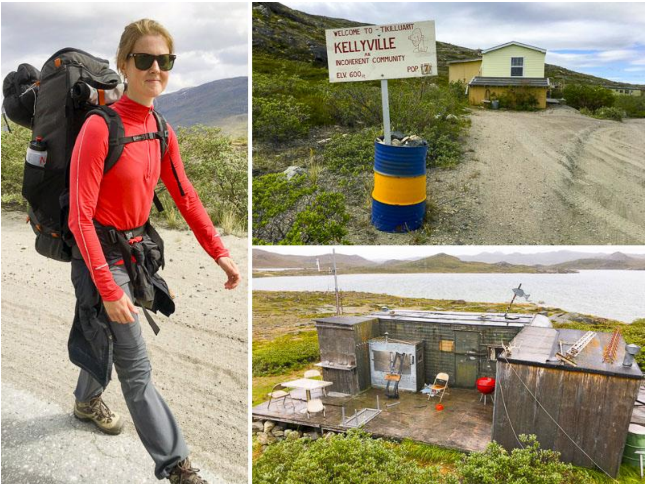
Kia på vej mod Kelly Ville, en flække med blot 7 indbyggere. Nederst th barakken ved Hundesø.

Efter Kelly Ville starter turen først rigtigt, og vi møder rutens første varde. En nedtrådt jordsti fører os de sidste 3-4 km hen til Hundesø, hvor en gammel og nedslidt 'caravan' - med påklitstrede træskure - bliver vores første overnatningssted. Den varme dag har tydeligvis sat gang i insektlivet, og om aftenen overfaldes vi af hærskarer af myg og fluer - i øvrigt den eneste gang på turen, vi har det "problem".